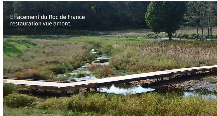
Effacement du Roc de France restauration vue amont.

La libre circulation est à rétablir dans les deux sens, sur les ouvrages hydroélectriques, des dispositions sont à prendre pour éviter la mortalité des poissons dévalant par les turbines (plan de grille et exutoire ou turbine ichtyo-compatible).